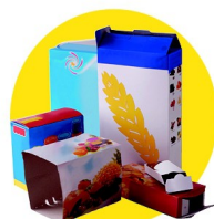
Emballages en carton