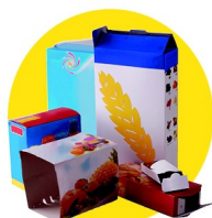
Emballages en carton