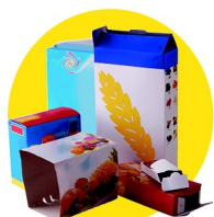
Emballages en carton