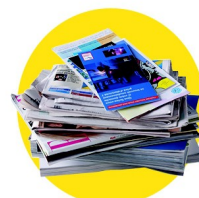
Papiers, journaux, magazines