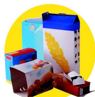
Emballages en carton