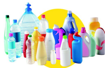
Bouteilles et flacons