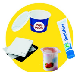
Pots et boîtes