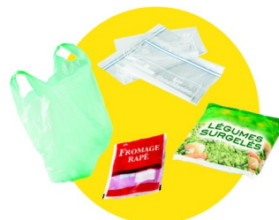
Sacs et sachets