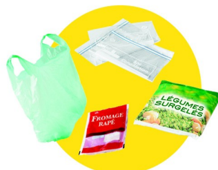
Sacs et sachets